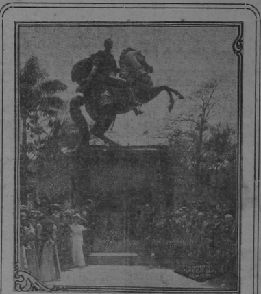
La estatua ecuestre de Simón Bolívar, Padre y Fundador de las Repúblicas de Colombia, Venezuela, Ecuador, Perú y Bolivia erigida en la ciudad de Caracas, en donde nació el 24 de Julio de 1783.

Como un homenaje a la memoria del Libertador Simón