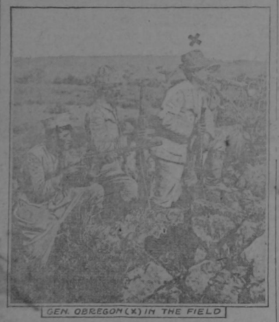
GEN. OBRAGON (X) IN THE FIELD